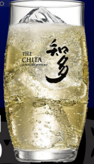
知多【ハイボール】 1杯 ¥1,500

やわらかな味わいと、 ほのかに甘い香り ウイスキーらしい 確かな熟成感があり、 軽やかな飲み心地が特長です。