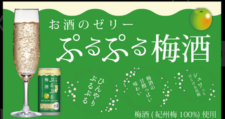
ぷるぷる梅酒スパークリングゼリー ¥650