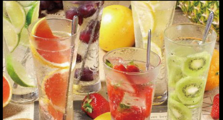
果実ごろごろぶっこみフルーツサワー (いちご・レモン・ライム) 各種 ¥650