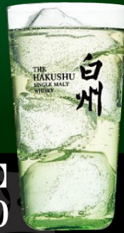
白州【ハイボール】 1杯 ¥1,500

南アルプスの天然水で 仕込まれ森の蒸留所で 育まれたフレッシュな香り、 スツキリとしたキレのある 爽やかな味わい