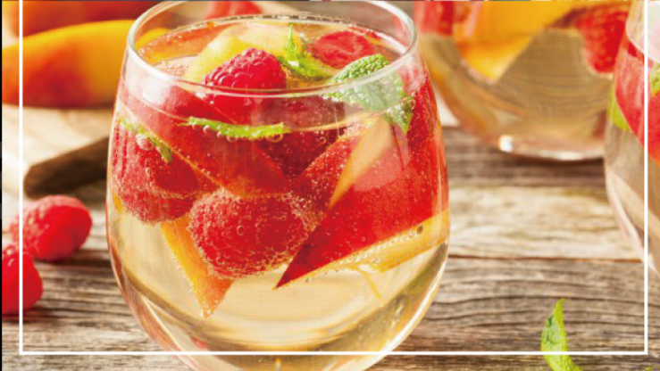
果実漬け込みサンテリア 【赤・白】各種 ¥650